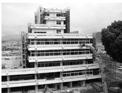
解体工事が進む市役所本庁舎

また、新しい施設の建設に際して、市民の皆さんの声をお聴かせいただくため、このたび「ワークショップ」を開催します。ぜひご参加ください。