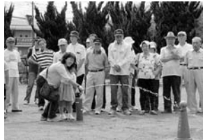
▲地域の自主防災訓練