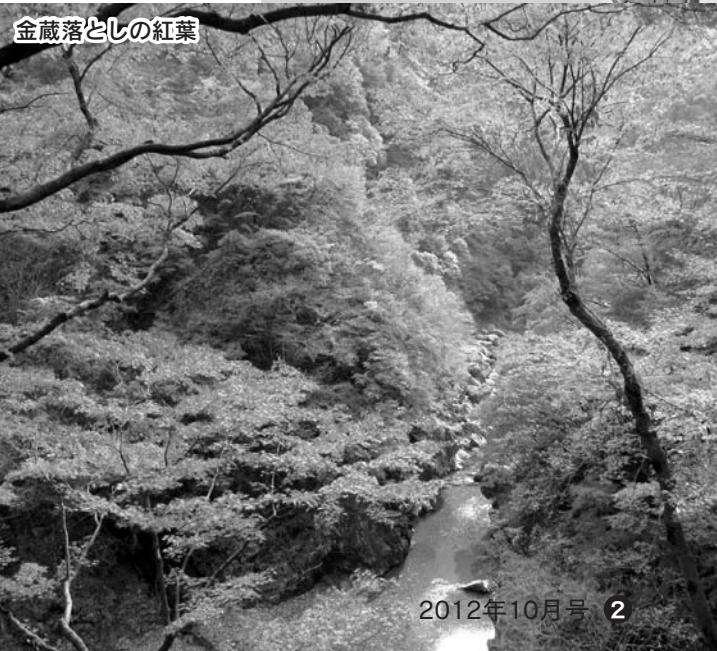
金蔵落としの紅葉