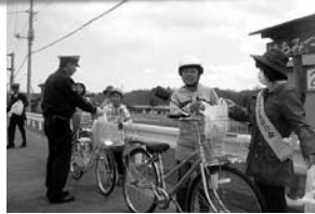
▲交通安全キャンペーン