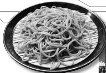
▲新そばまつり当日、そば食事処では、荒川産のそば殻を利用した環境に優しい容器を使用します。