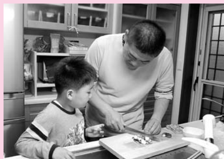
西 貴子さん(大野原) 「パパ、指切らないでね。」