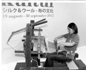
シルク&ウール-布の文化 19 augusti - 30 september 2012