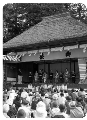
▲古き良き農村歌舞伎の情景を今に残しています。

とき 午前11時～午後3時頃 ところ 寺尾 萩平地内 ・萩平子ども歌舞伎「青砥棉花紅彩画 稲瀬川勢揃之場」、「吉例曾我対面 工藤館之場」 ・秩父歌舞伎正和会「菅原伝授手習鑑」 吉田社頭車引之場」 ※長唄(柳糸会)、津軽三味線、秩父屋台囃子(上寺尾お囃子会)なども披露されます。 問 文化財保護課 ☎22-2481