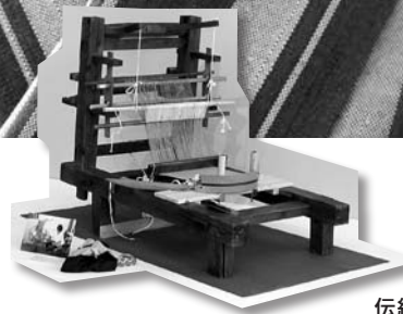
伝統的な手織り織機の居座機 (いざりばた)