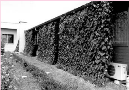
事業所の部... 医療法人花仁会秩父病院作品